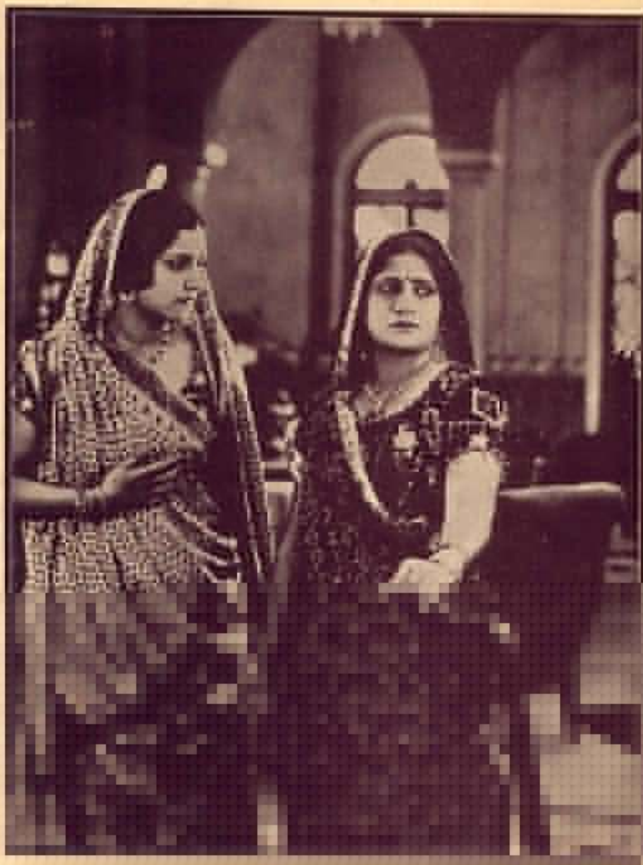
MISS [Name] and MISS [Name]